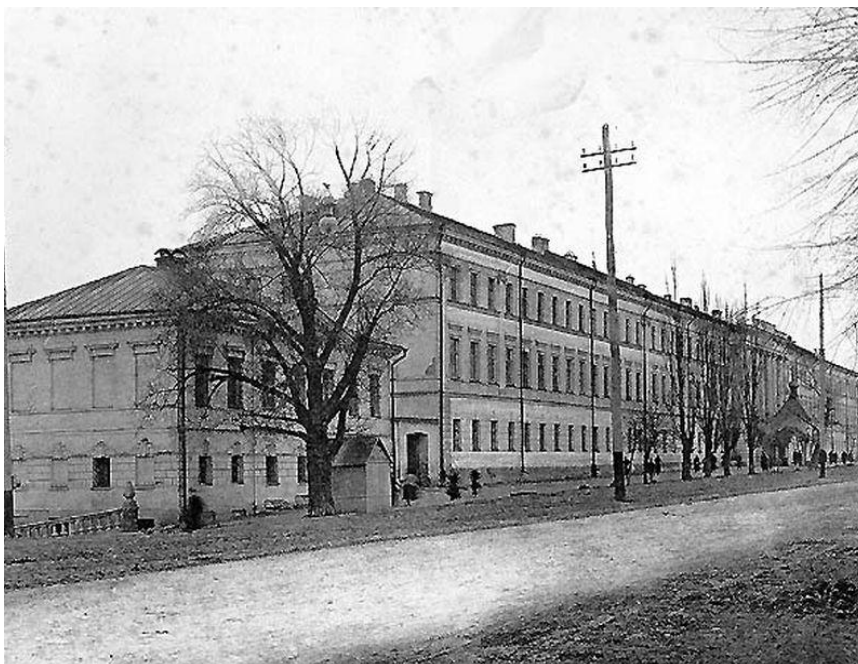
Фото 1. Воронежская духовная семинария.

Для надзора за Духовными учреждениями из представителей временного комитета в 1809 году была образована группа из церковных училищ. По семинариям рассылали снова собранные конспекты по богословию и философии. К 1815 году силами священника Феофилакта (Русанова) и М. М. Сперанского был разработан устав новых Академий, училищ и семинарий.