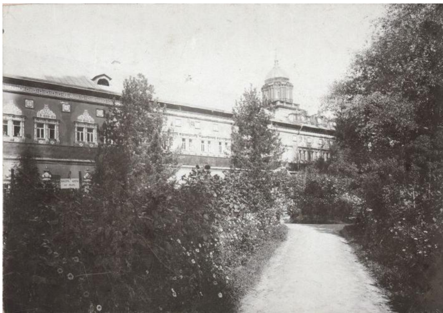
Фото 2. Московская духовная академия.

Не всё из запланированного получилось реализовать. Количество духовных академий, образованных к концу правления Александра I, было существенно меньше предусмотренных проектом, но всё же их количество заметно возросло. В 1809 году в России было 150 духовных училищ, а в 1825 году их было уже 345. Уровень образования в образовательных учреждениях заметно возрос, а академии, освобожденные от семинарских курсов стали ведущими центрами научного богословия.