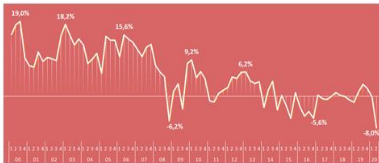
Рис.1. Доходы населения России в % по кварталам за 2000-2020 гг.

Стоит отдельно рассмотреть и данные Росстата за нынешний год, в котором вирус Covid-19 значительно повлиял на все слои общества в Российской Федерации. Безусловно, карантинные меры сказались на уменьшение показателей дохода населения страны, а именно в первом квартале упадок вышел на 4,8%, во втором – на 8,4% (рис.1). На снижение доходов также повлиял высокий уровень безработицы, который в начале года составлял 4,7%, а в августе – 6,4%. Минэкономразвитие прогнозирует снижение безработицы до 5,7% к концу 2020 года. Но все вышеуказанные снижения не влияют на продолжительный рост зарплат в стране, по данным Федеральной налоговой службы в период с января по август 2020 года уровень зарплаты вырос на 2,6%.